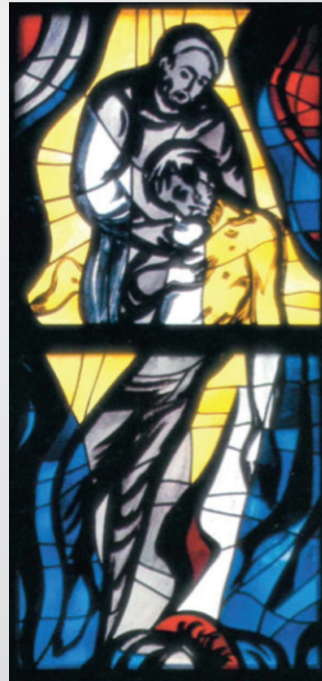
Der barmherzige Samariter, Fensterbild in der Kapelle